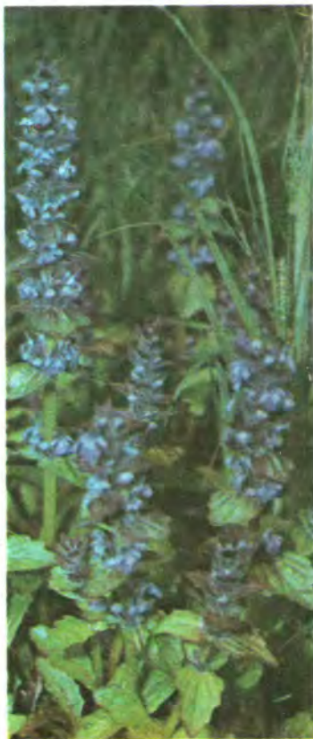
31. Горлянка повзуча.